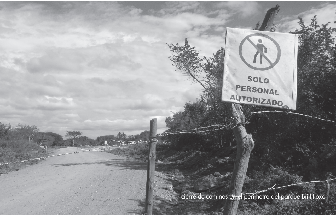
cierre de caminos en el perímetro del parque Bñ Hioxo

Elaborado por Educa en base al "United States Geological Survey" USGS.