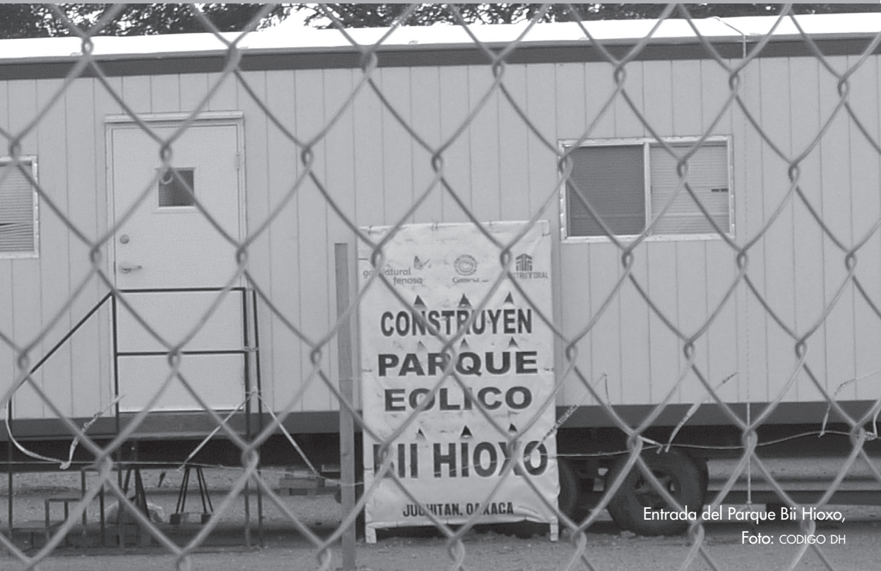
Entrada del Parque Bii Hioxo